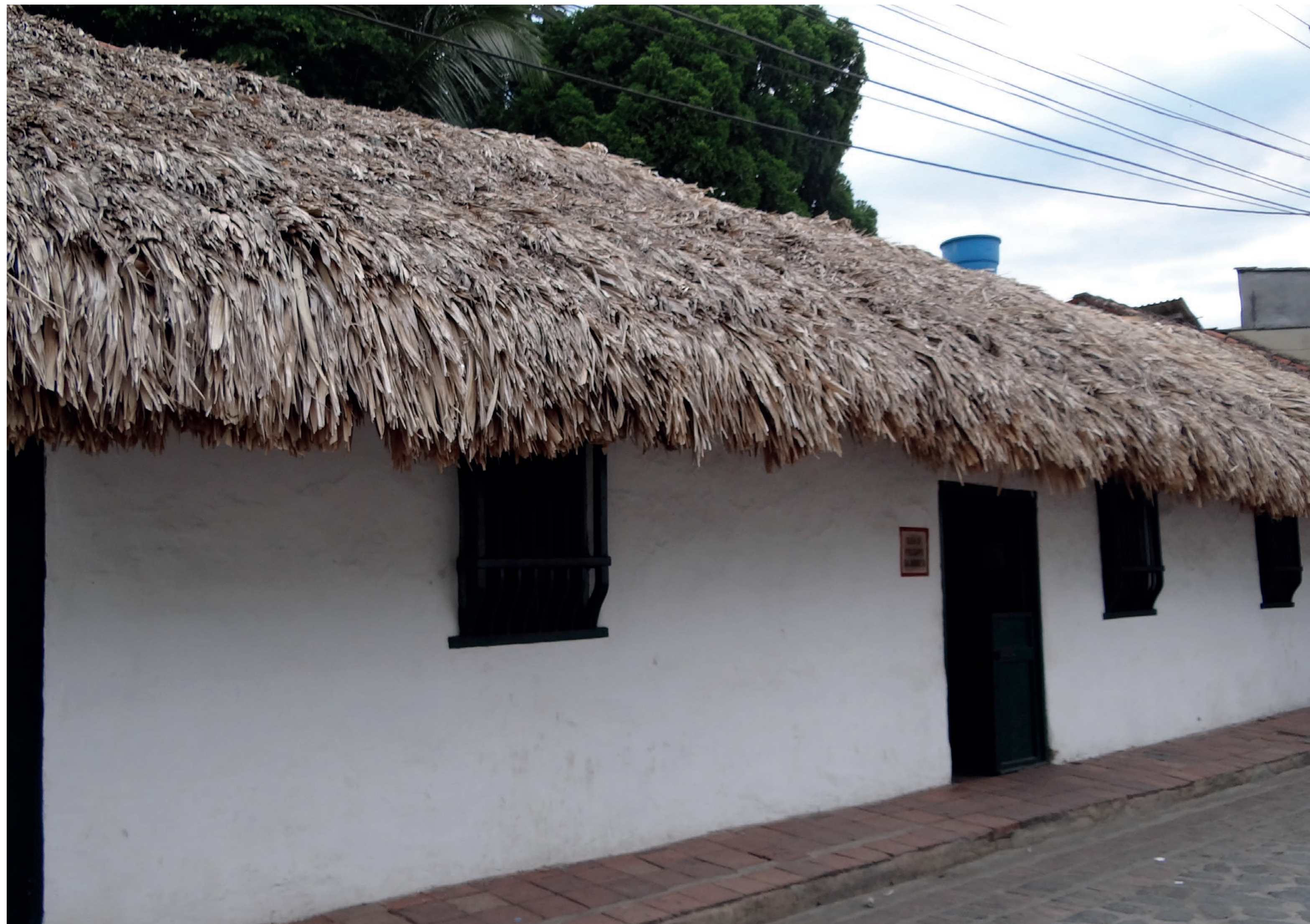
Casa Museo Policarpa Salavarrieta, en Guaduas, Colombia.