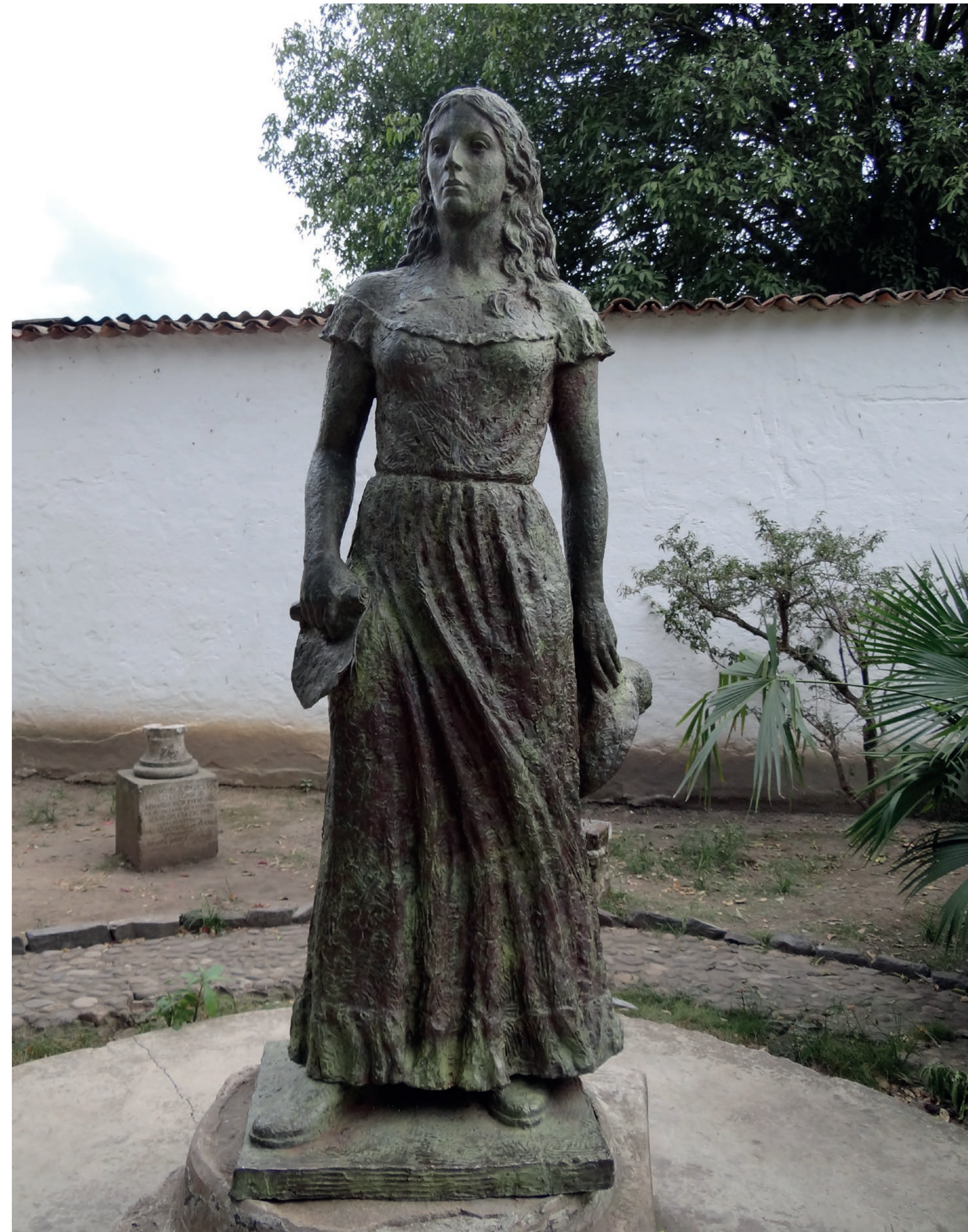
Estatua de Policarpa Salavarrieta en la Casa Museo de Guaduas, Colombia.

Muchas otras mujeres del mismo período lucharon por la causa patriota. Entre ellas se encuentran Manuela Beltrán Archila, declarada Heroína de la Nueva Granada; Agustina Ferro, que se unió a la resistencia patriótica y fue fusilada, y María Antonia Santos Plata, también asesinada.