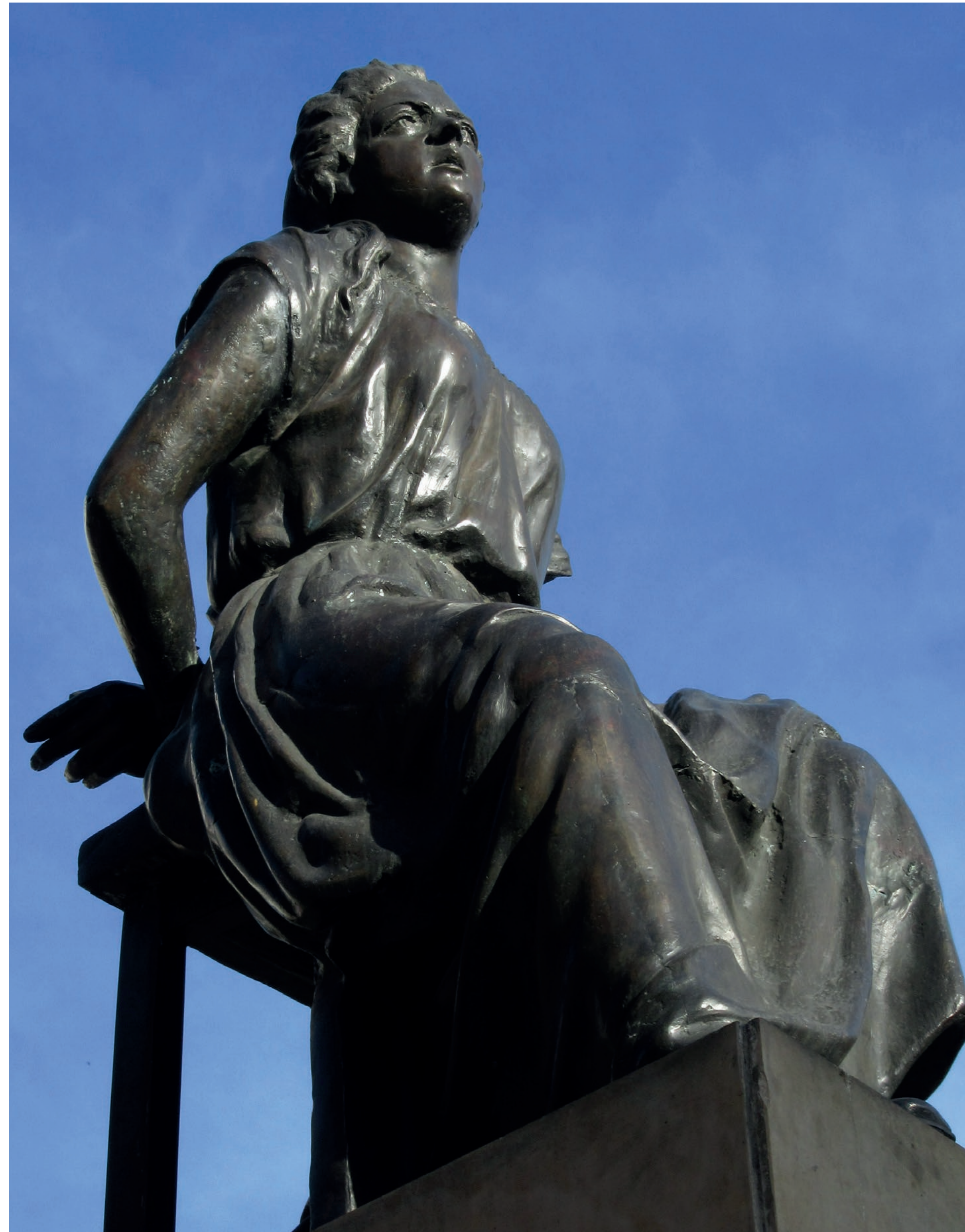
Monumento a Policarpa Salavarrieta, en Bogotá.

Cuando el ejército español en la región capturó a su prometido, este llevaba consigo documentos que demostraban que Policarpa estaba involucrada en las acciones contra los realistas. Ella no pudo salvarse, pero antes de ser capturada, pudo advertir a sus compañeras en la red de espías para que destrozaran la evidencia que las incriminaba. Antes de morir fusilada, Policarpa gritó: “Muero por defender los derechos de mi patria”.