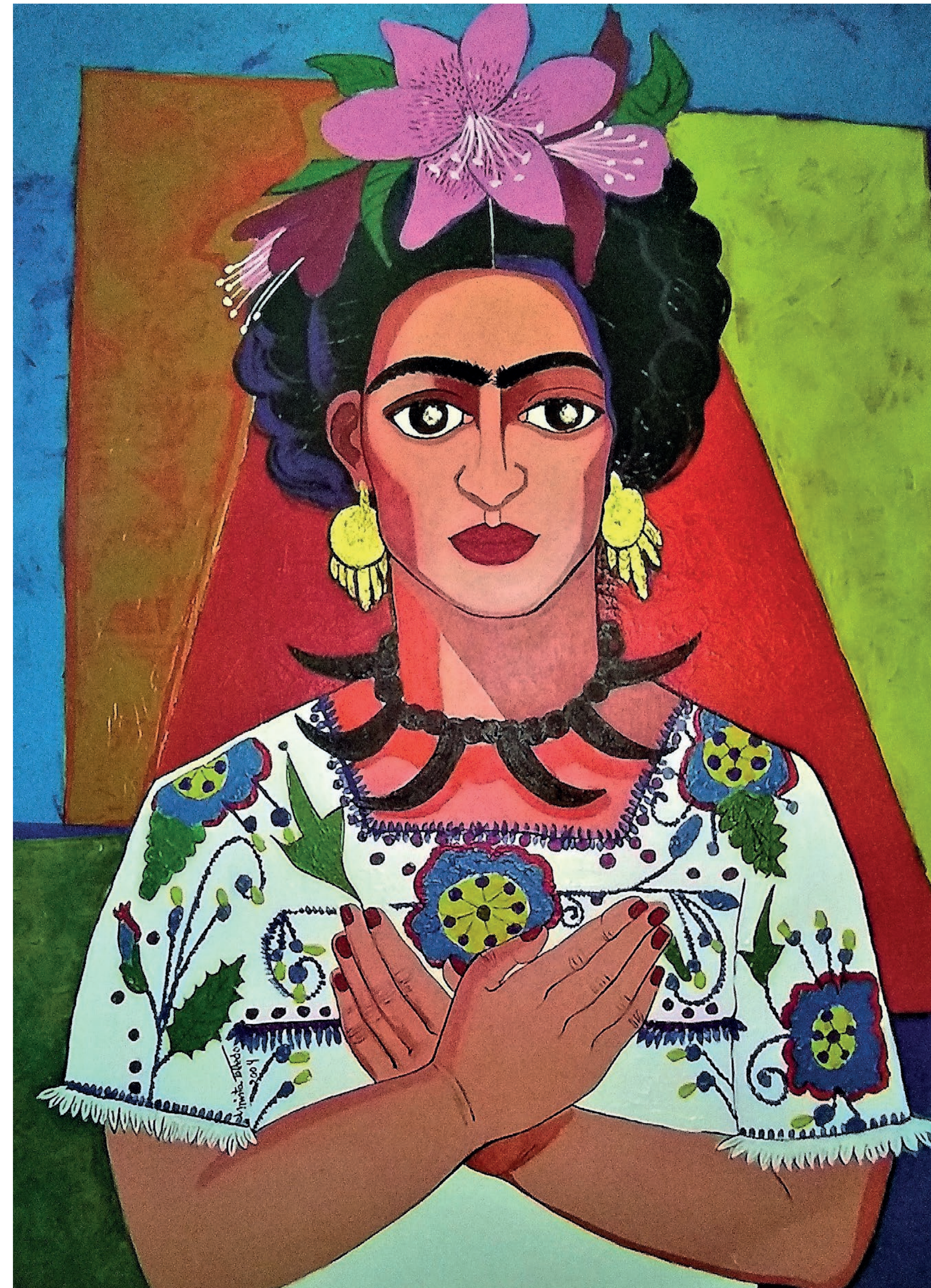
La Eterna, 2004

En su arte, Mirta también celebra a grandes mujeres latinoamericanas. Esta pintura es un retrato de la pintora mexicana Frida Kahlo, cuya obra gira alrededor de diversos episodios autobiográficos. Frida tomó al arte popular mexicano de raíces indígenas como referente directo en su vida y en su obra.