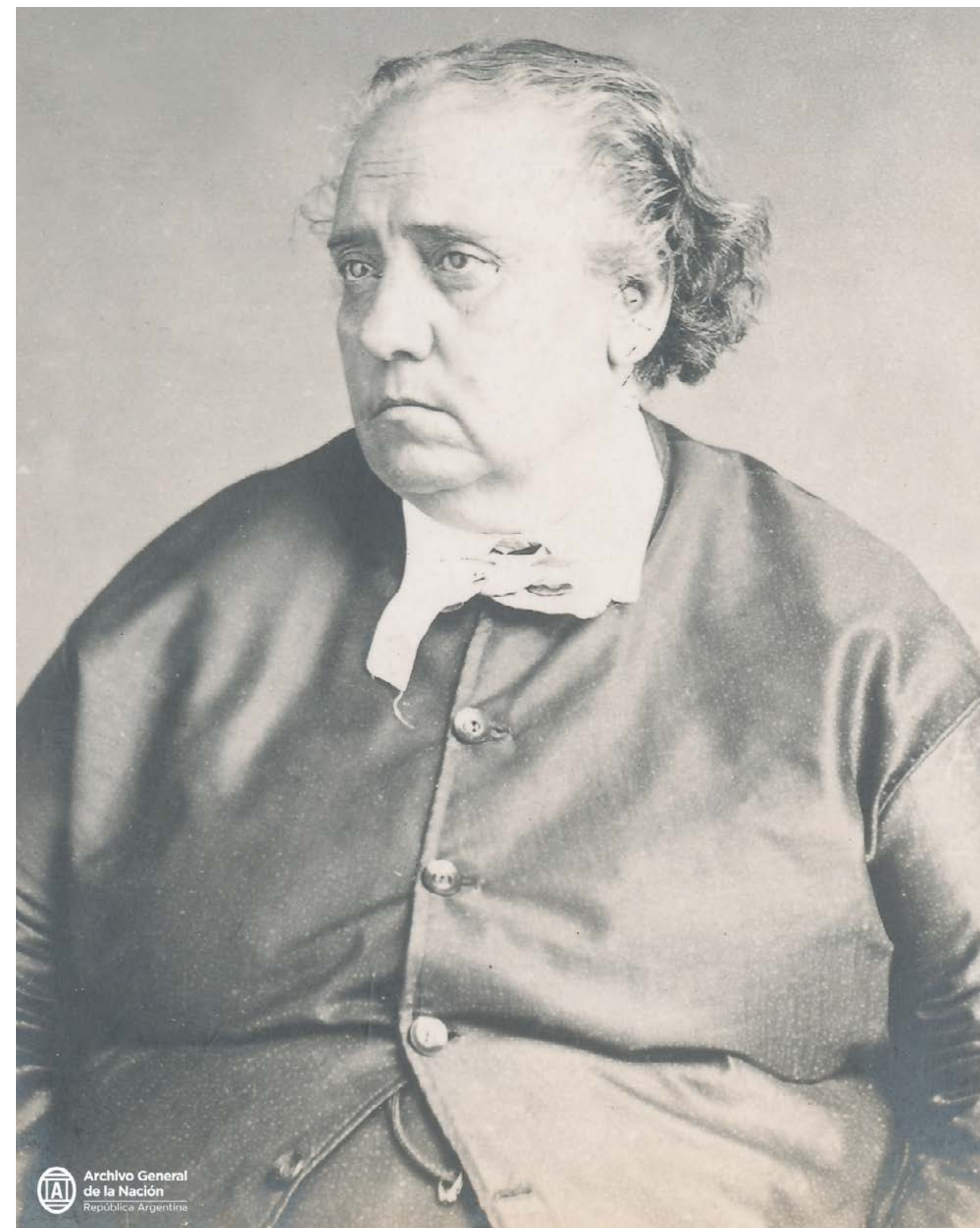
Fotografía de Juana Manso, Archivo General de la Nación.